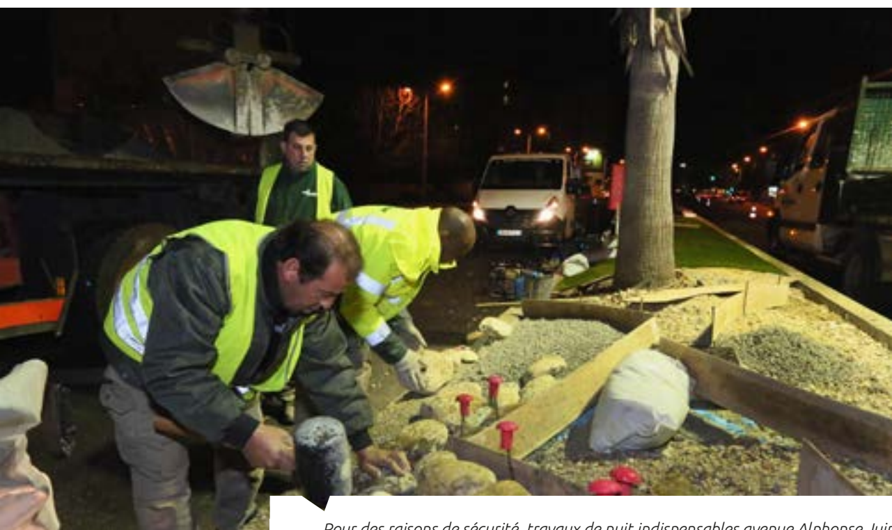
Pour des raisons de sécurité, travaux de nuit indispensables avenue Alphonse Juin

Cette réalisation exemplaire, ayant nécessité plusieurs interventions de nuit, illustre la volonté de poursuivre dans la voie du développement durable. L'attestent d'autres aménagements paysagers réalisés dernièrement dans le même esprit, comme sur le rond-point de la 9 e DIC par exemple.