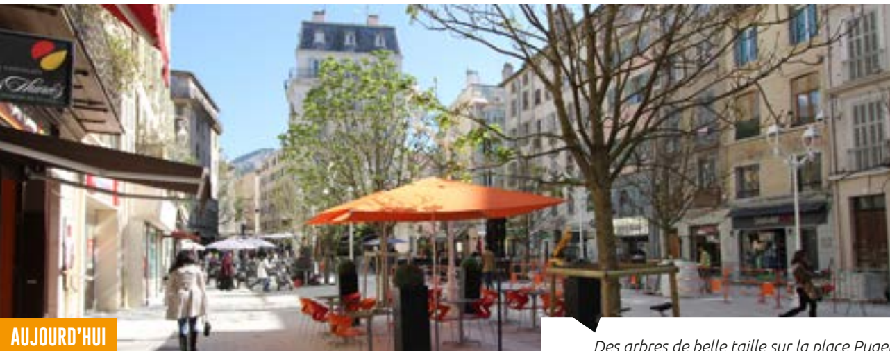
Des arbres de belle taille sur la place Puget

Fluidité et cohérence, telles sont les orientations fortes de la Ville. Du point de vue des aménagements tout d'abord : le revêtement améliorant peu à peu l'ensemble des axes et places apporte un côté lumineux. En témoignent les