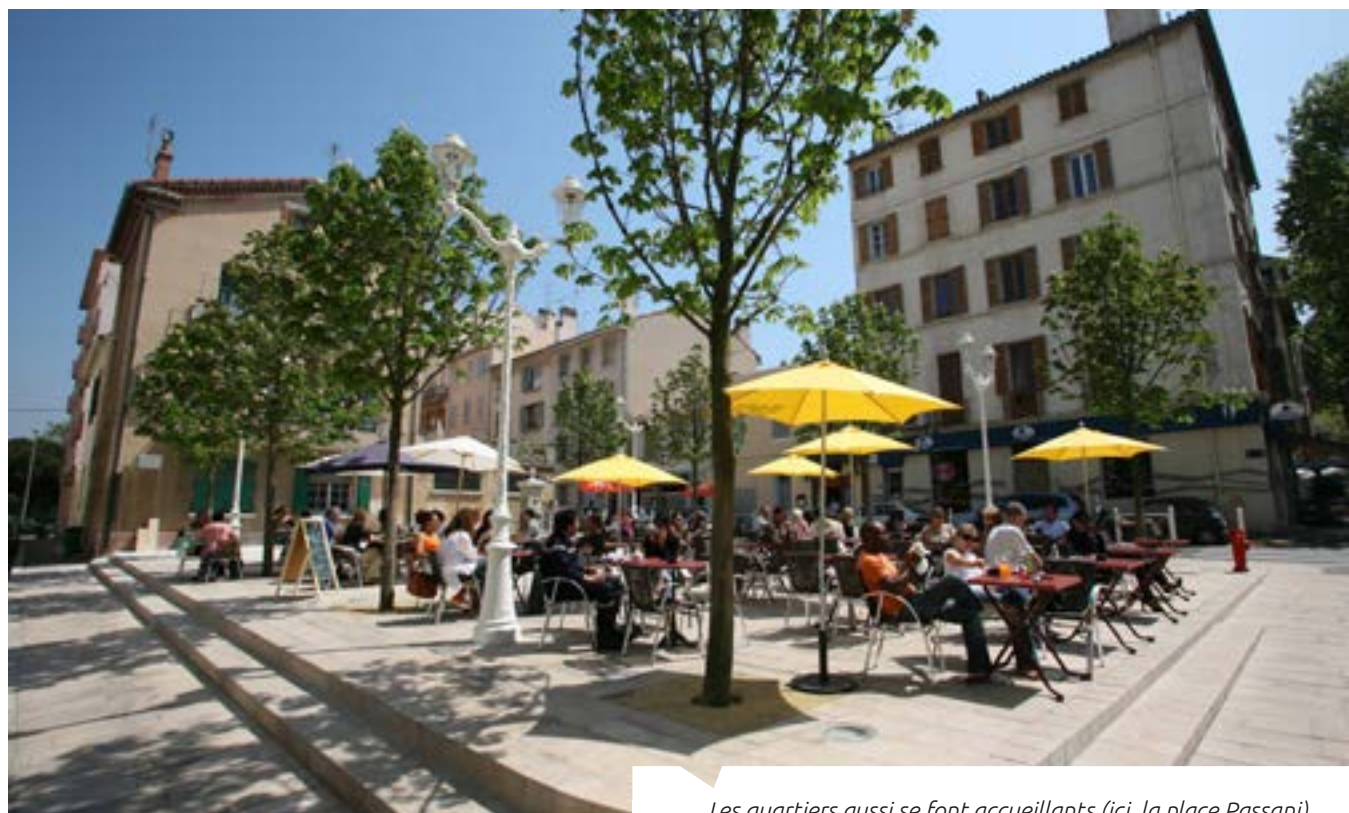
Les quartiers aussi se font accueillants (ici, la place Passani)