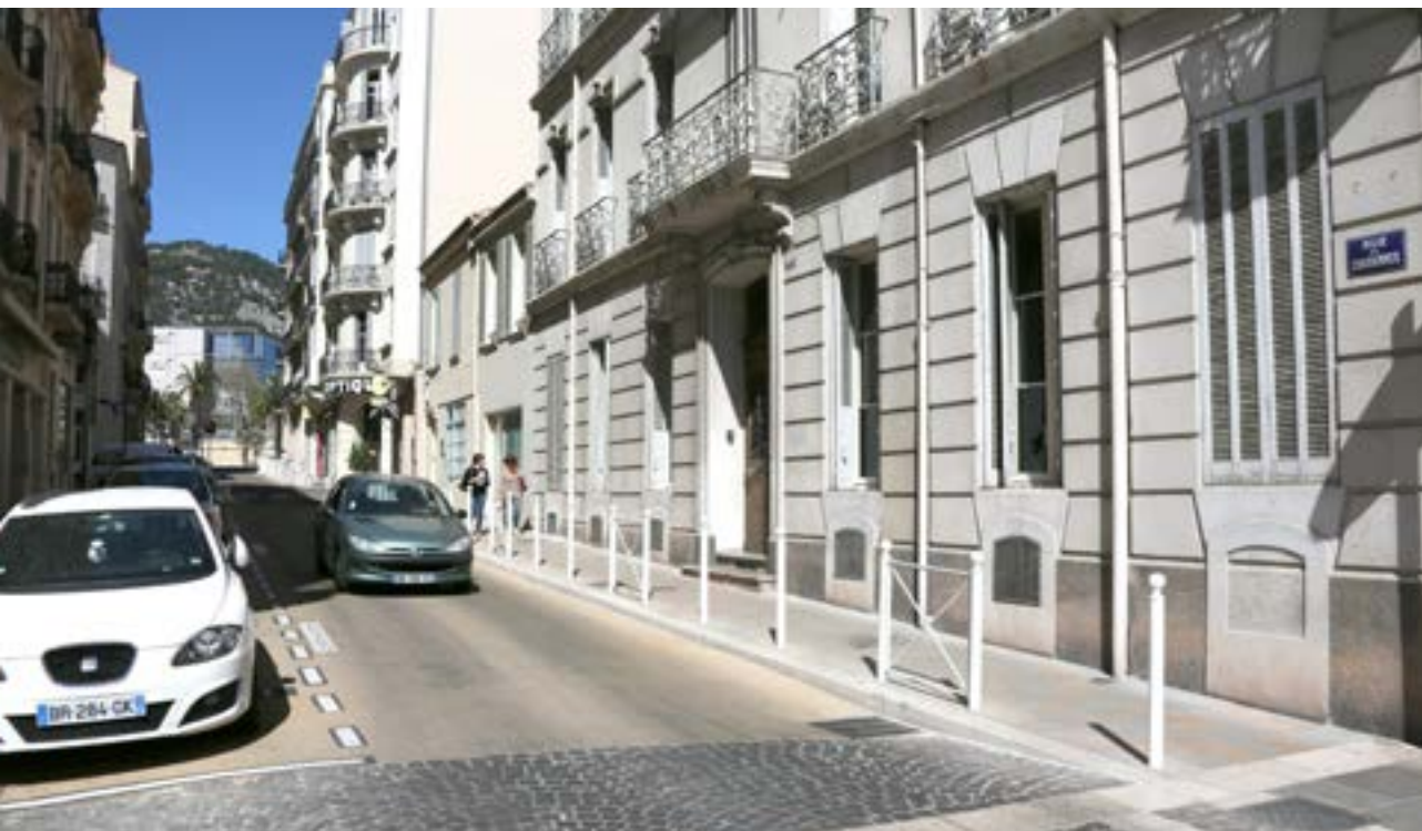
Revêtement phonique et nouveaux trottoirs gagnent du terrain en haute-ville, comme rue de Chabannes ci-dessus

* ANRU : agence nationale pour la rénovation urbaine