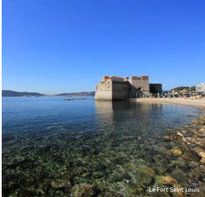
Le Fort Saint Louis