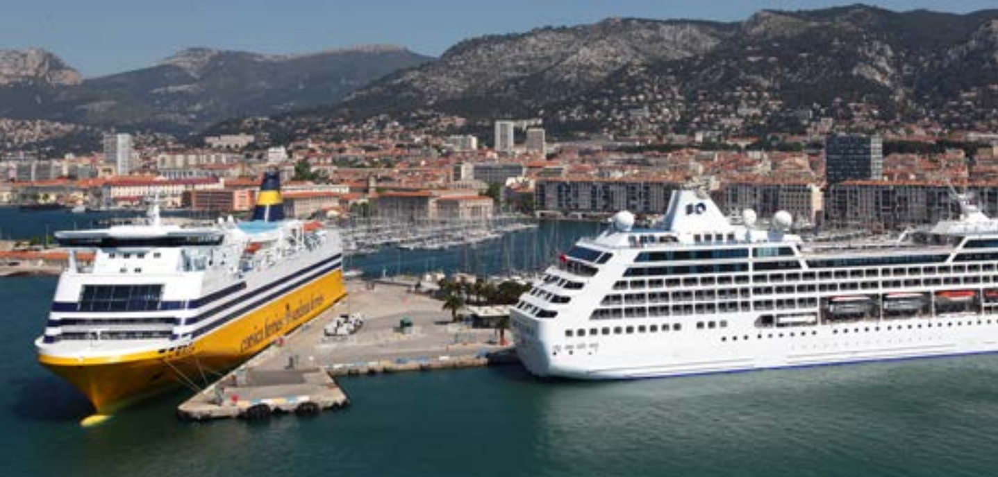
Toulon, 1 er port de liaison avec la Corse, accueille aussi un nombre croissant de croisiéristes