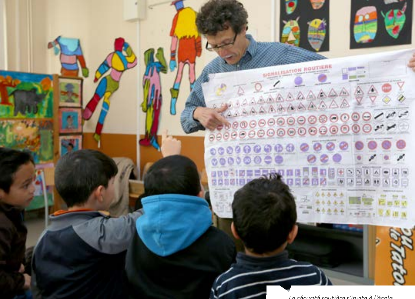
La sécurité routière s'invite à l'école

suivre, à vélo et en respectant les indications, un circuit matérialisé au sol et qui permet aux enfants d'acquérir les bons réflexes !