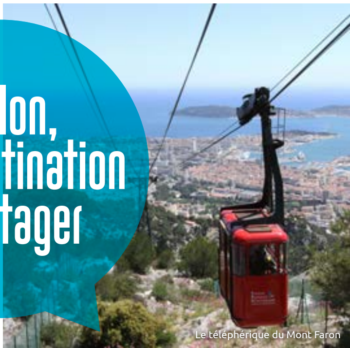
Le téléphérique du Mont Faron