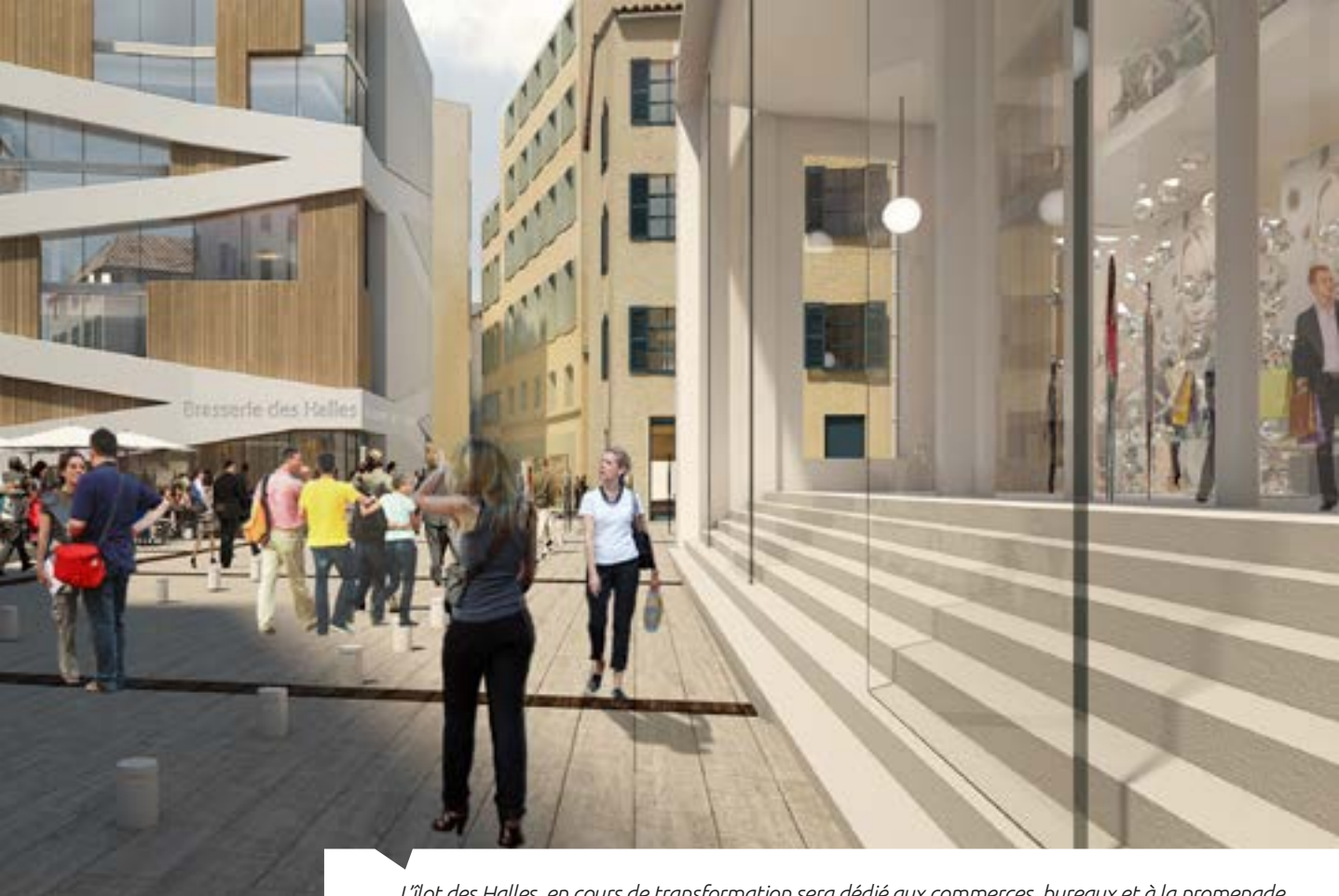
L'îlot des Halles, en cours de transformation sera dédié aux commerces, bureaux et à la promenade