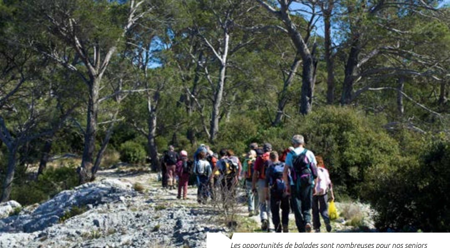
Les opportunités de balades sont nombreuses pour nos seniors