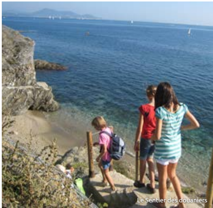
Le Sentier des douaniers