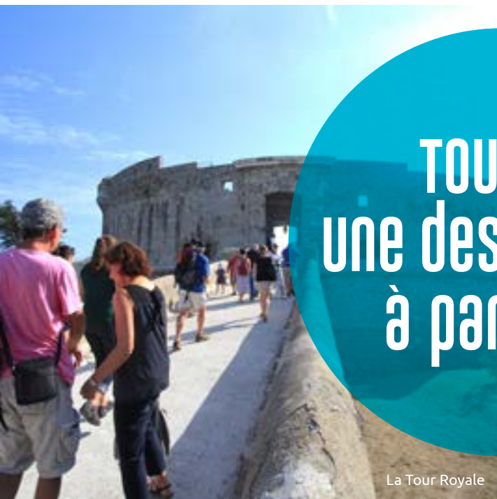
La Tour Royale