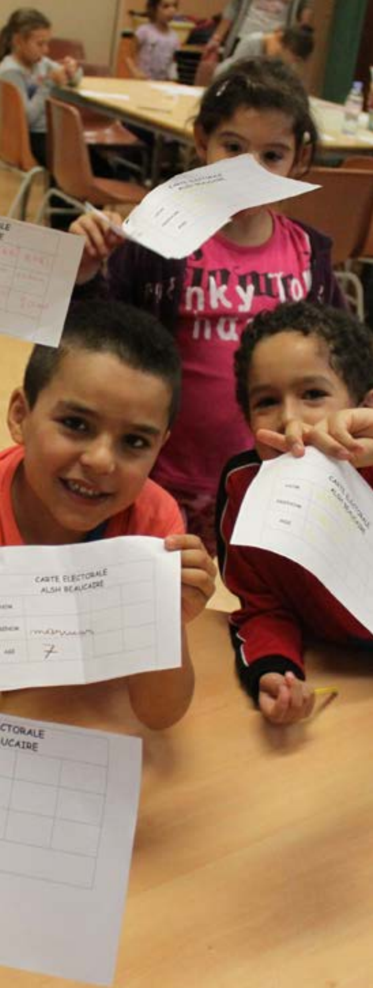
Les enfants votent à la Baucaire