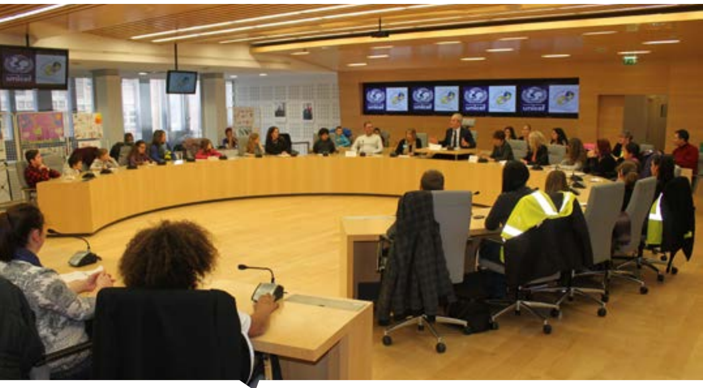
Les enfants des centres de loisirs en « séance extraordinaire », salle du Conseil municipal

Le thème de l'atelier : participer à la création d'une île en 3D, comme au cinéma, a trouvé une résonance auprès de ces jeunes passionnés. Mais avant d'insérer un objet dans un jeu vidéo, il faut le fabriquer de manière à le rendre visible de tous les côtés, c'est le principe de la 3D