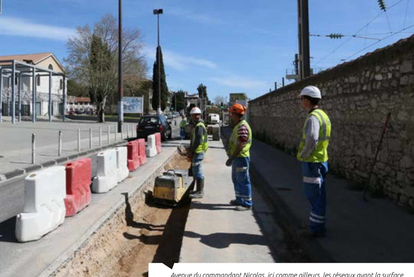
Avenue du commandant Nicolas, ici comme ailleurs, les réseaux avant la surface

gée. Derniers exemples en date, dans le centre ancien, les rues Daumas et Micholet et les rues Hoches et Andrieu, traitées en même temps que la place Puget. Suivront, la préparation du renouveau de la rue d'Alger (jusqu'au port), entre juin et septembre, les rues Aicard, Baudin et Pyat (en cohérence avec la livraison de l'îlot Baudin) puis, à l'automne, la rue Pelloutier. Autant de réalisations inscrites dans le vaste projet de rénovation du centre ancien mené grâce au partenariat de l'ANRU* et qui fait la démonstration, à chaque nouvelle réalisation, d'un « redémarrage commercial lié à la reconquête urbaine, comme ce fut par exemple le cas sur le Cours Lafayette ».