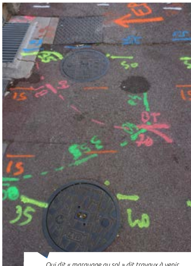
Qui dit « marquage au sol » dit travaux à venir

Un peu plus haut dans la ville, la rue Chabannes est terminée et on « attaque » le premier tronçon de Victor Clappier, chaussée et trottoirs. Avenue du commandant Nicolas, la réfection des réseaux en cours sera suivie par la pose d'un revêtement phonique (tout comme le