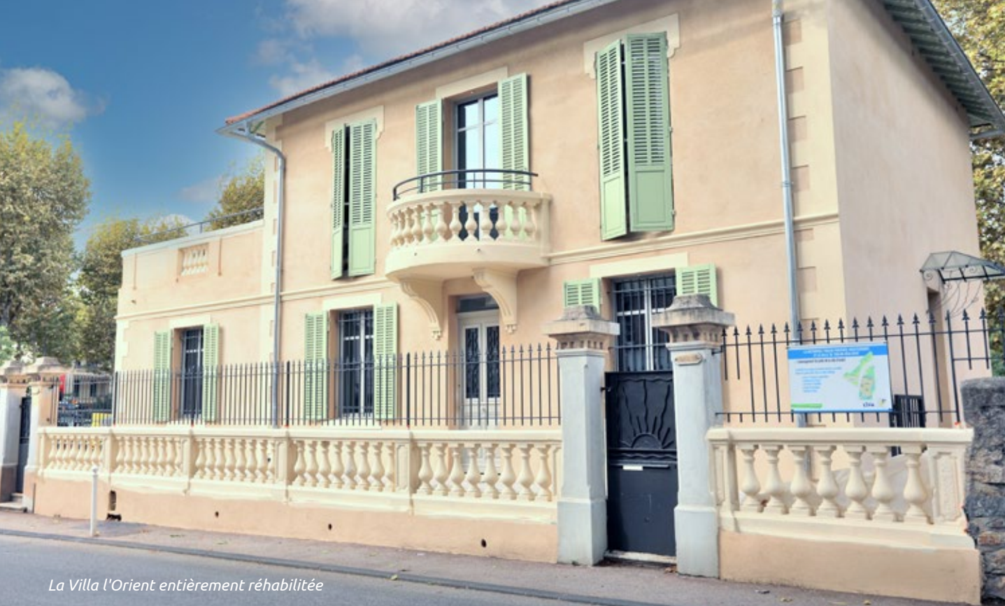
La Villa l'Orient entièrement réhabilitée