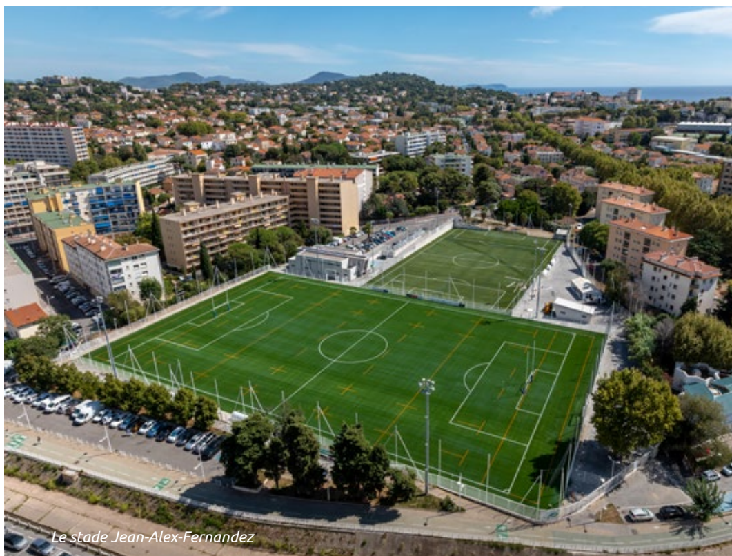
Le stade Jean-Alex-Fernandez

taille (12m sur 4) et de la fontaine à boire. D'une surface de 600m 2 , il offrira un espace de détente dans un cadre ombragé : une huitaine d'arbres seront plantés dont la frondaison rejoindra celle qu'offrent déjà des grands sujets qui entourent la propriété (platane centenaire, muriers platanes, palmiers). Les espaces verts invitant au repos, des bancs seront installés autour des arbres et des murets en pierre sèche avec assise en bois construits. On pourra même venir au jardin à vélo et le stationner sur un rack prévu à cet effet.