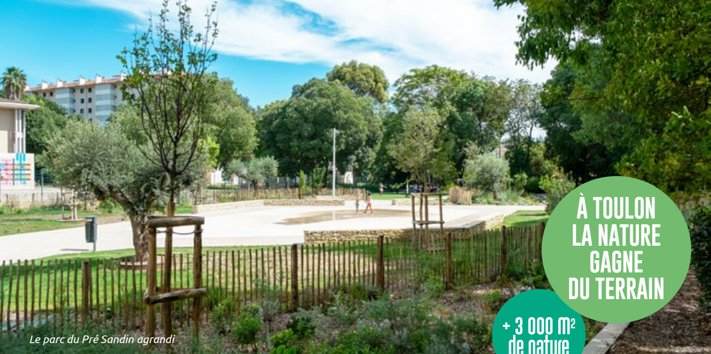
Le parc du Pré Sandin agrandi