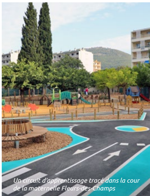
Un circuit d'apprentissage tracé dans la cour de la maternelle Fleurs-des-Champs

Savoir nager en toute sécurité ou savoir rouler à vélo : ces deux apprentissages sont indispensables aux 3 - 12 ans. Dans ce cadre et depuis de nombreuses années, les piscines toulonnaises accueillent 280 classes par an pour développer l'aisance aquatique. En 2023, Toulon a été choisi comme ville pilote pour expérimenter le dispositif Savoir rouler à vélo qui a pour objectif de rendre les enfants autonomes à vélo et de les encourager à pratiquer un mode de déplacement plus respectueux de l'environnement. Plus de 1 800 élèves de CM2 y ont participé. Comme l'an dernier, les futurs collégiens, encadrés par les éducateurs sportifs municipaux vont apprendre comment circuler à bicyclette, en toute sécurité, sur la voie publique. Ces séances se dérouleront sur le secteur du Palais des Sports et dans certaines écoles comme Fleurs-des-Champs ou François-Nardi avec du matériel (vélo, casques et chasubles) mis à disposition par la Ville de Toulon.