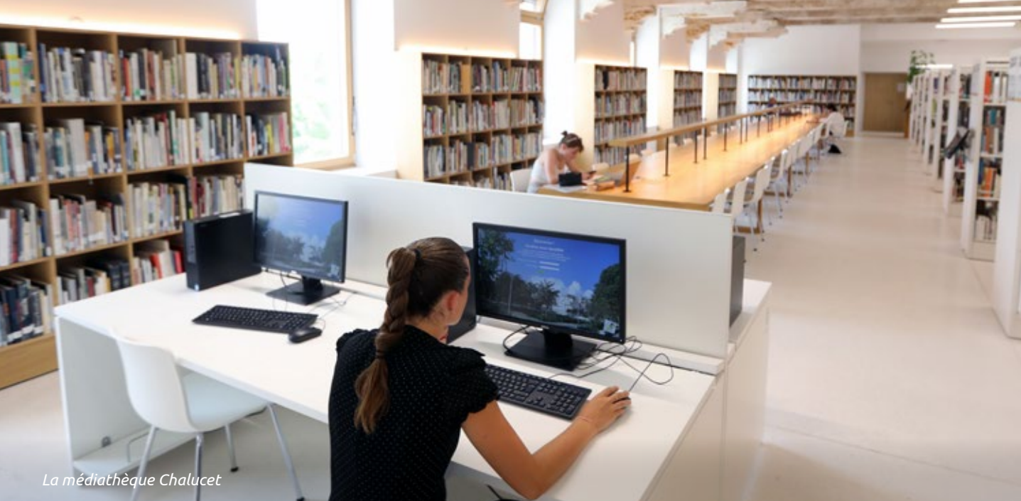
La médiathèque Chalucet