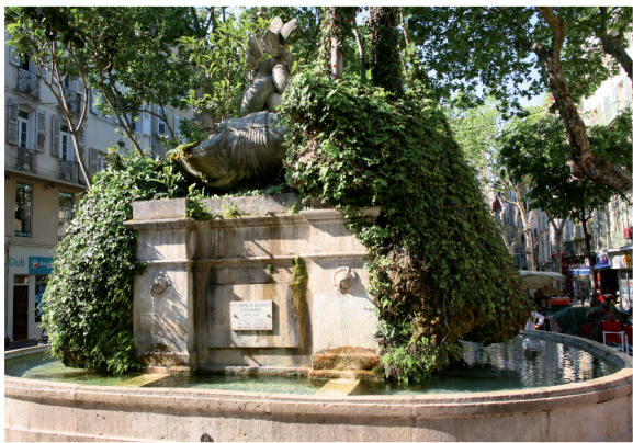
Fontaine des Trois Dauphins